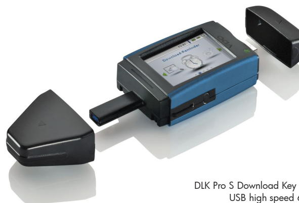
DLK Pro S Download Key avec port USB high speed 6 broches