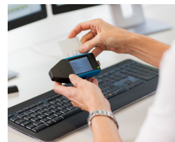
Téléchargement direct depuis la carte conducteur ou entreprise